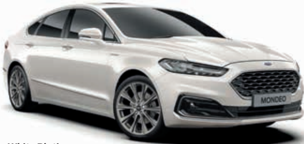
White Platinum Lakier metalizowany specjalny 3 050,-