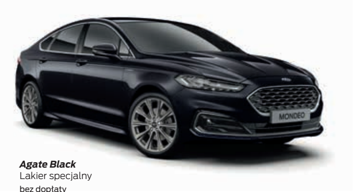
Agate Black Lakier specjalny bez dopłaty

• wyposażenie standardowe wyposażenie dostępne tylko w pakiecie lub z inną opcją