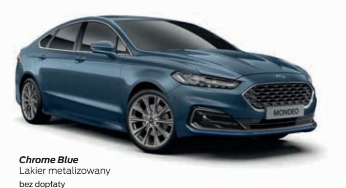
Chrome Blue Lakier metalizowany bez dopłaty