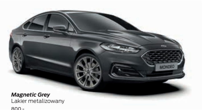
Magnetic Grey Lakier metalizowany 800,-