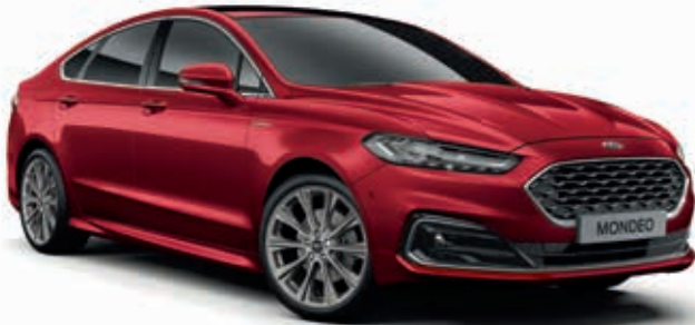
Lucid Red Lakier metalizowany specjalny 1 150,-