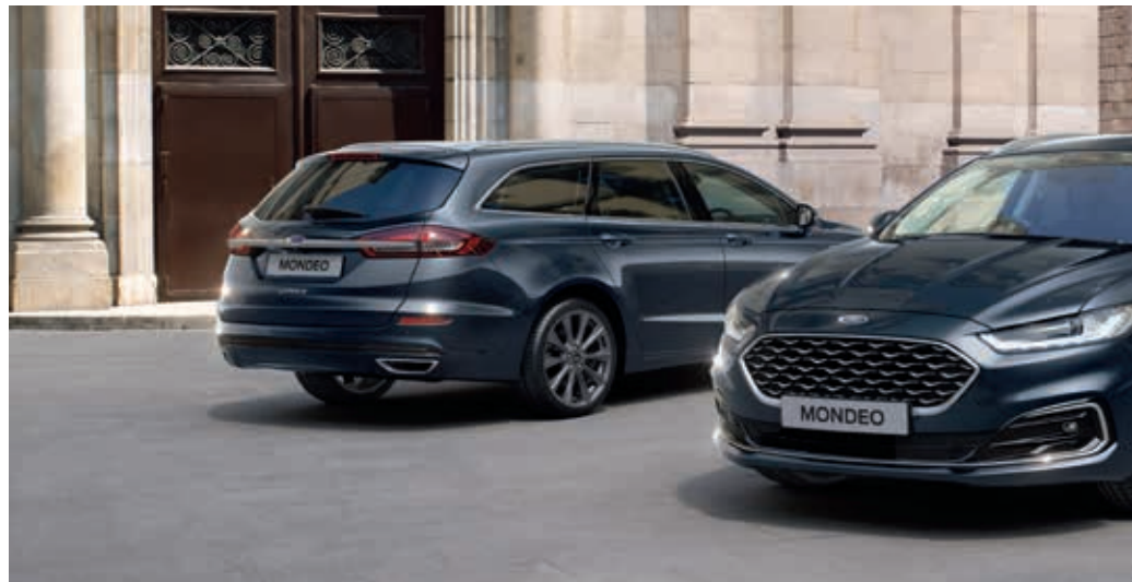
Ford Mondeo Vignale w kolorze Blue Panther (opcja) oraz 19" opcjonalnymi obręczami ze stopów lekkich