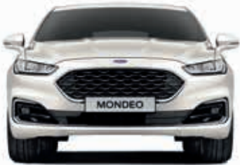
Szerokość całkowita z/bez lusterek bocznych: 2121/ 1852 mm