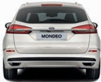
Szerokość całkowita ze złożonymi lusterkami bocznymi: 1911 mm

** Pomiar zgodnie z normą ISO 3832. Rzeczywiste wymiary mogą się różnić od podanych wartości w zależności od wersji wyposażenia.