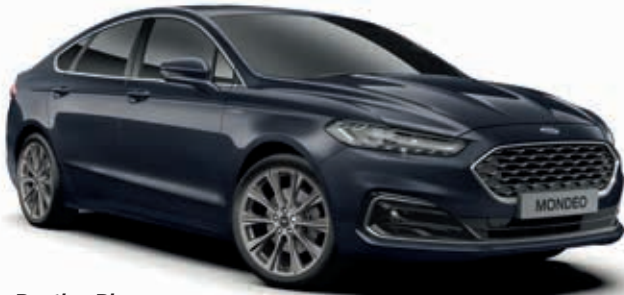
Panther Blue Lakier metalizowany 1 150,-