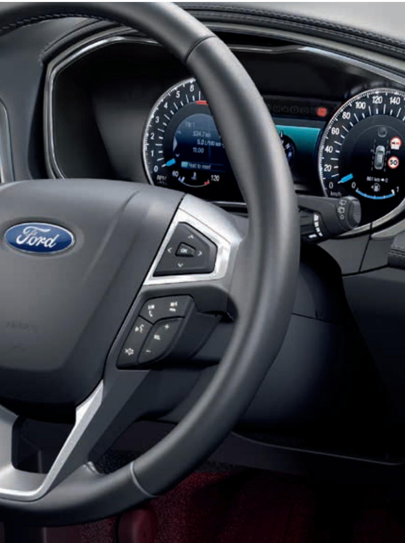
System nawigacji satelitarnej Premium oraz deska rozdzielcza pokryta skórą