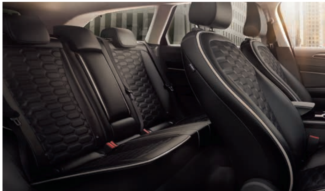
Ford Mondeo Vignale